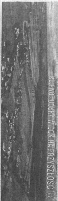
ROJEWO - DOBRY WIDOK NA PRZYSZŁOŚĆ

Potożona jest w centrum województwa na Kujawach, blisko dużych ośrodków miejskich, jakimi są Bydgoszcz, Toruń, Inowrocław, co pozwala mieszkańcom korzystać z dorobku gospodarczego, kulturowego i bazy sportowo-rekreacyjnej tych miast. Dominującym działaniem gospodarki w gminie jest rolnictwo usytuowane głównie w południowej części gminy, gdzie występują żyzne gleby i czarne ziemi kujawskie. Zanimskujący tam rolnicy korzystają z funduszy unijnych, dzięki temu cały czas rozbudowują swoje gospodarstwa.